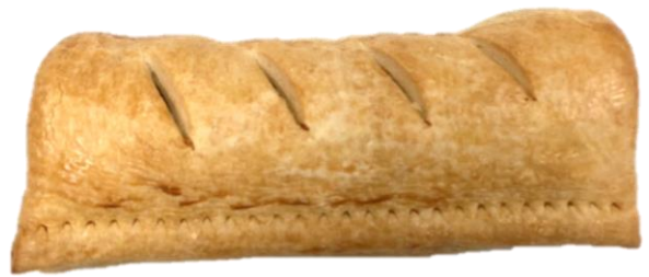
ลักษณะปกติของสินค้า