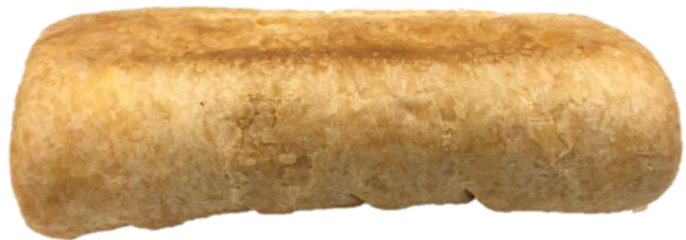
อาจพบการหลุดร่อนของแป้งบริเวณเปลือกนอกของสินค้า