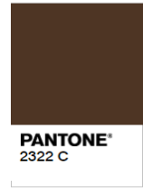
Rejected (Too Dark)